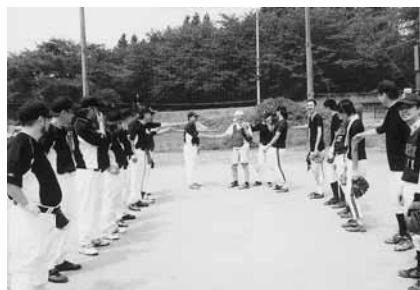
北上支部チームと試合終了後の挨拶