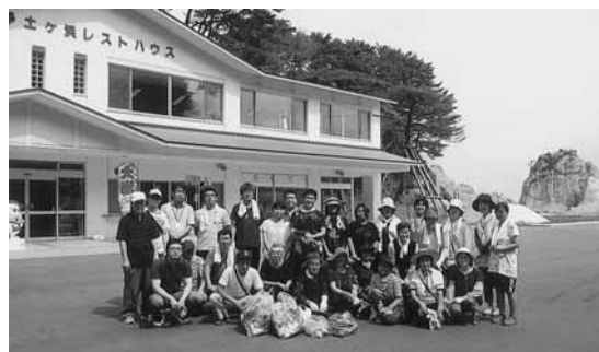
宮古支部の皆さん