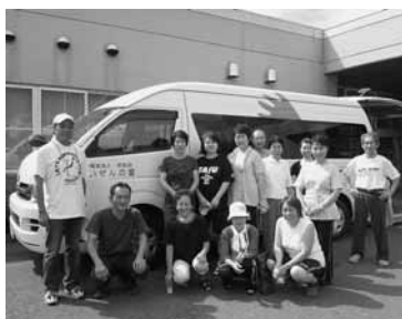
釜石支部の皆さん

業界のイメージアップと社会貢献に来年以降もご協力のほど、よろしくお願いたします。