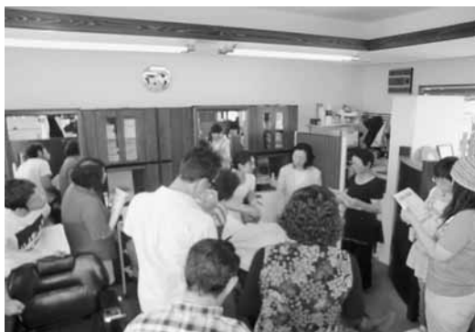
エステ勉強会の模様