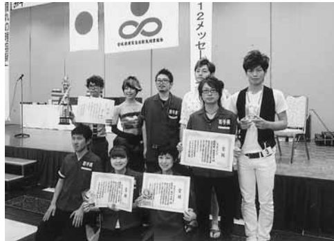
東北理容競技大会 岩手県選手団の皆さん