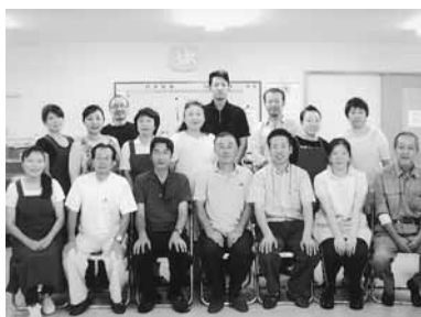
北上支部の皆さん