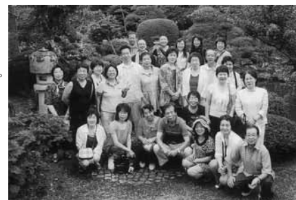
於御苦楽園 北上支部の皆さん