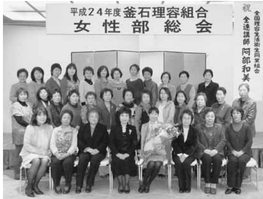
女性部総会参加者の皆さん

セレモニー終了後は、いつも通り懇親会となり、ホテルのお料理をいただきながら、辛い事態を乗り越えた笑顔、笑顔が並び、元気に再会できた喜びと、再出発を誓った「執念の花」が、部屋いっぱい咲き乱れました。団結心の強い釜石女性部は決意