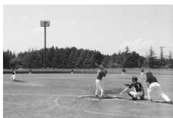
遠野支部との熱戦