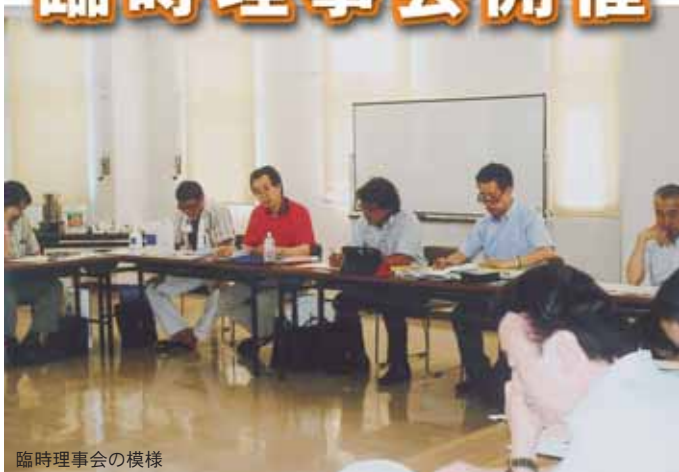
臨時理事会の様様