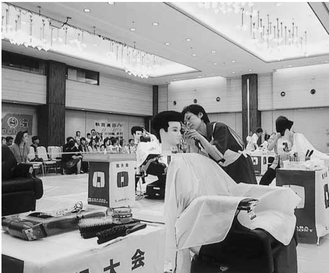
東北理容競技大会 熱戦風景