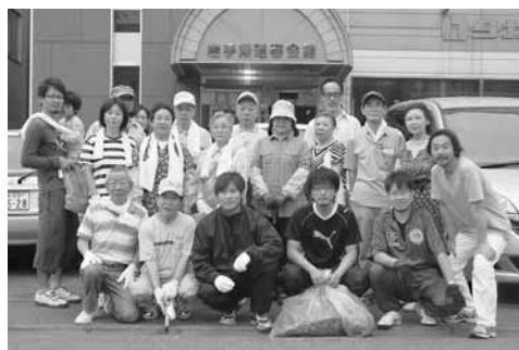
盛岡支部の皆さん